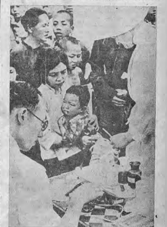
La foto muestra una de las numerosas clínicas de emergencia establecidas en la zona de las concesiones extranjeras, donde centenares de miles de chinos, hombres, mujeres y niños fueron inmunizados contra la terrible peste del cólera que causó grandes estragos al iniciarse la batalla de Shanghai. — También los japoneses hicieron lo mismo con sus soldados.